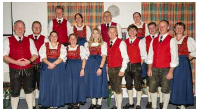
Neuer Vereinsvorstand der Bürgermusikkapelle Weißenbach am Lech