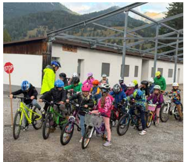
Am Montag, den 29. September nahmen alle Kinder unserer Schule am Fahrsicherheitstraining der Radfahrerschule „Easy Drivers“ am Weißenbacher Zeltplatz teil. Ein lehrreiches und tolles Erlebnis!

Wir wünschen allen viel Freude und Erfolg beim Lernen und Entdecken!