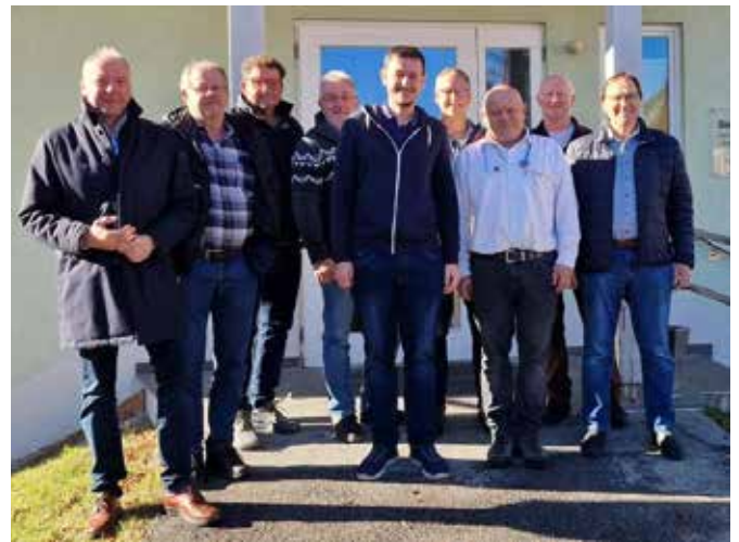
Gemeinsames Gruppenfoto vor der Praxis: